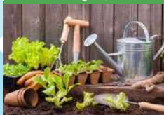
orto e sementi